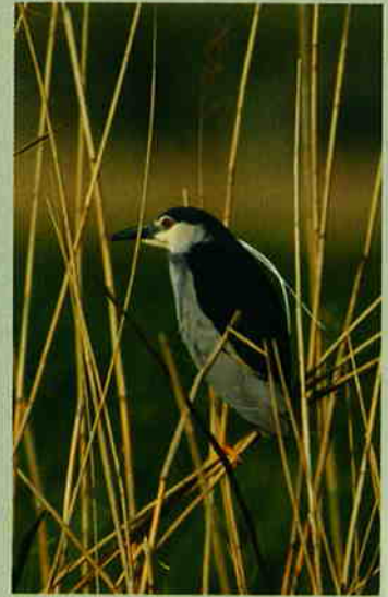
Gece balıkçılı ( Nycticorax nycticorax )

olan Türkiye'de de kuş gözlemciliği son beş yılda hızla arttı. Doğa Derneği ve birçok yerel kuş gözlem topluluğunun çabaları bu artışın destekçileri oldu.